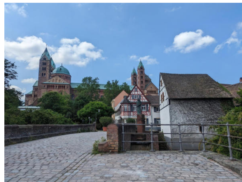
Kaiserdom zu Speyer